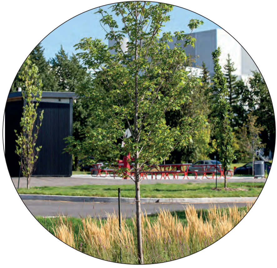
Plantation de 100 arbres