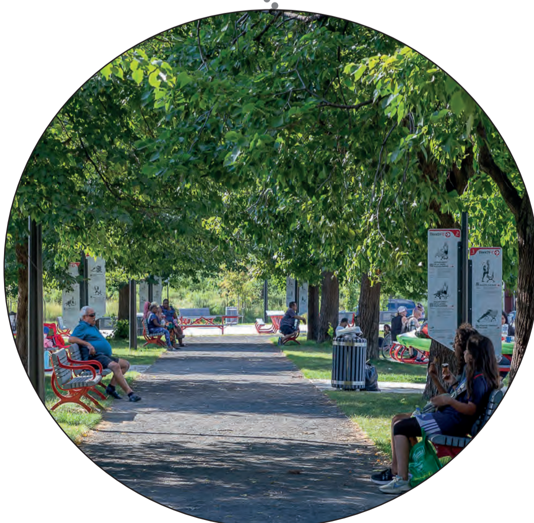
Benchfit - Programmes d'entraînement pour les aînés