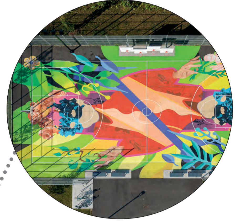
Un terrain de basket-ball adapté aux différents niveaux des joueurs