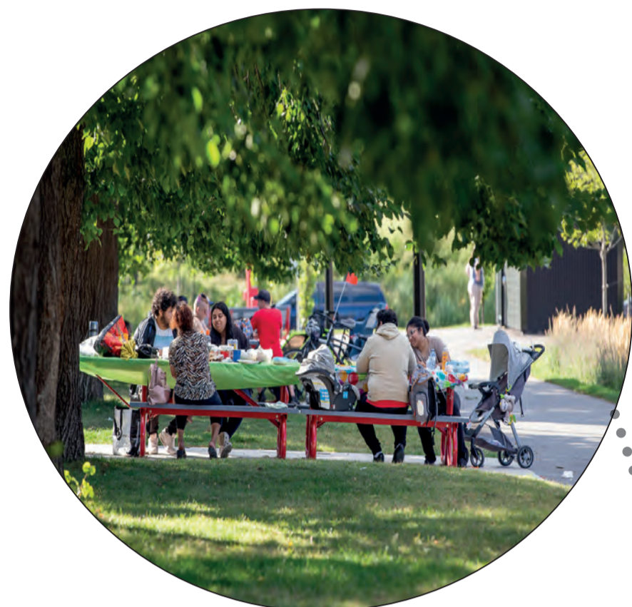
Aire de pique-nique ombragée