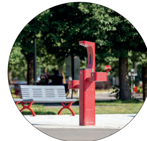
Fontaine à boire éco-responsable