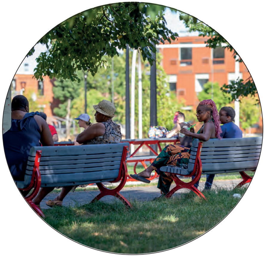
Un parc actif, inclusif et accueillant de 137 000 pi 2