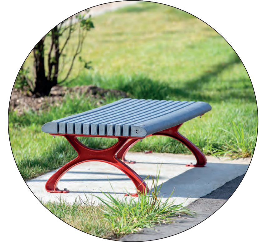
Une diversité de mobilier pour s'adapter aux conditions physiques de chacun