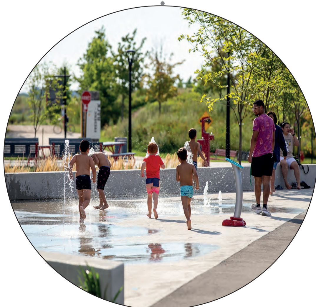
Point de rafraîchissement