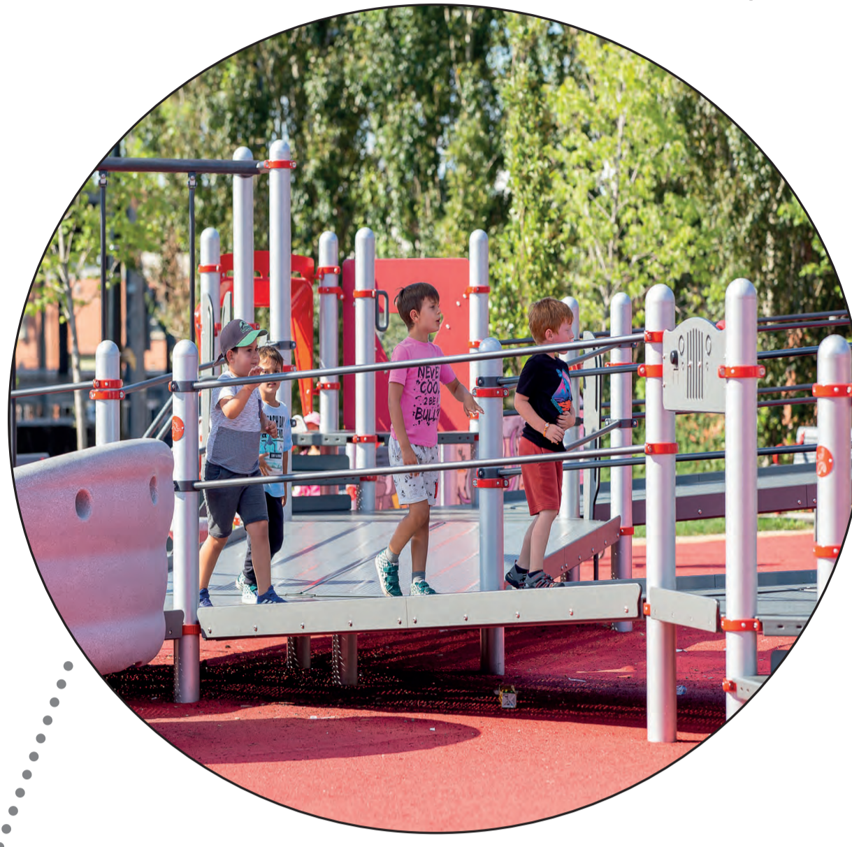
Une aire de jeu 2-12 ans de 16 000 pi 2 , inclusive pour tous les niveaux de motricité et de limitations