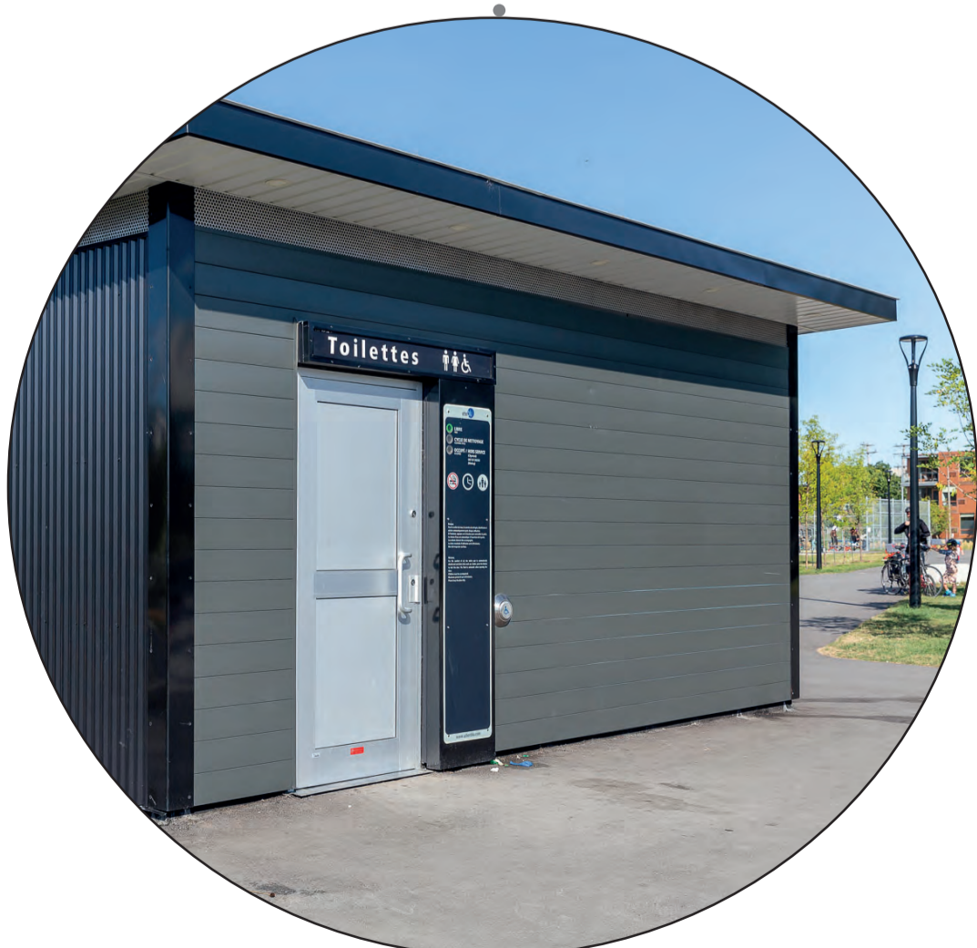
Bloc sanitaire accessible