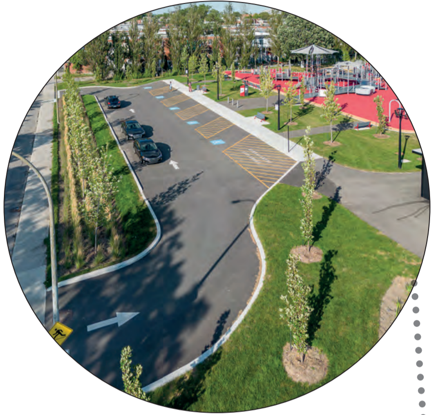
Stationnement adapté (5 places + 1 débarcadère transport adapté de la STM)